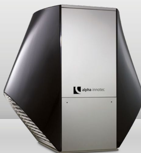
Vzduch/voda pro venkovní instalaci