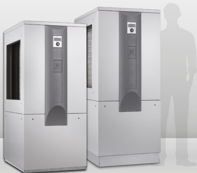
Vzduch/voda pro vnitřní instalaci